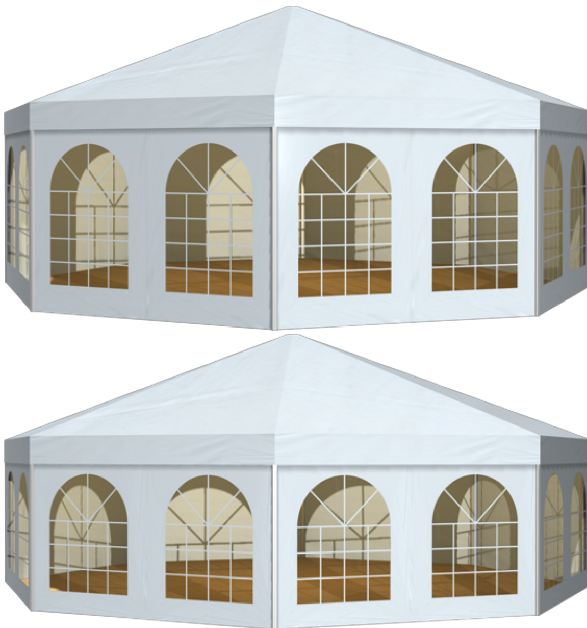
篷房俯视图与侧视图