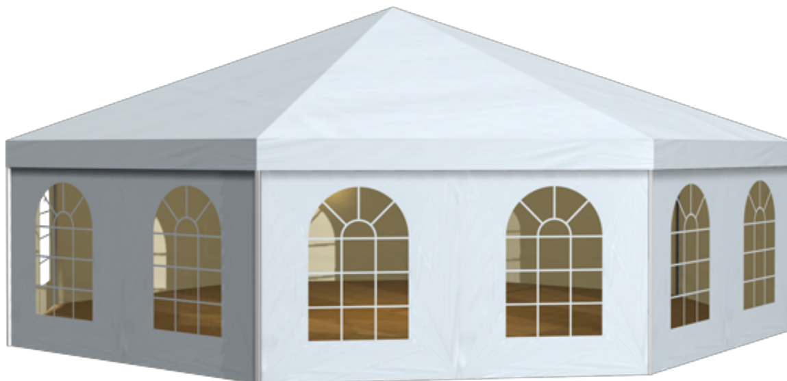
篷房俯视图与侧视图