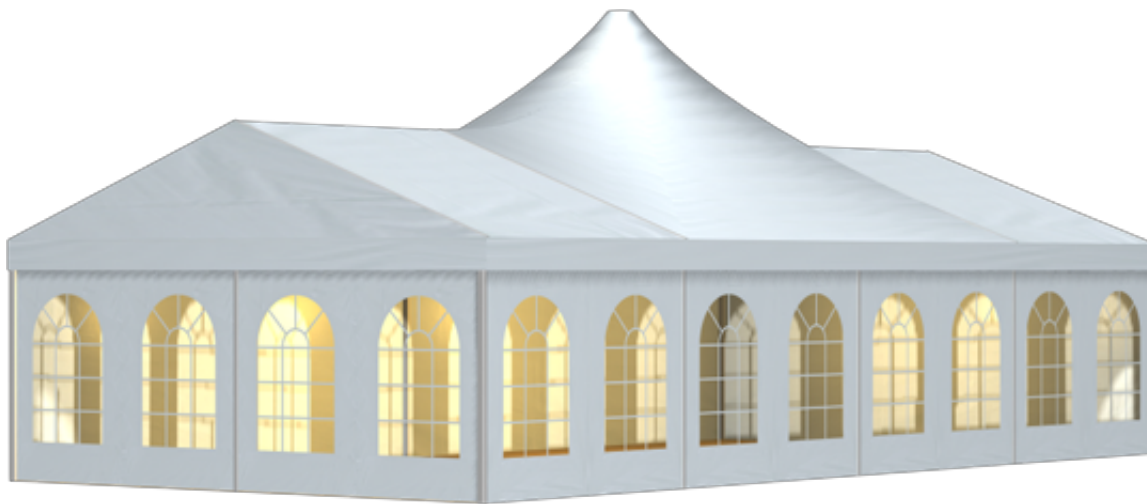
篷房俯视图与侧视图