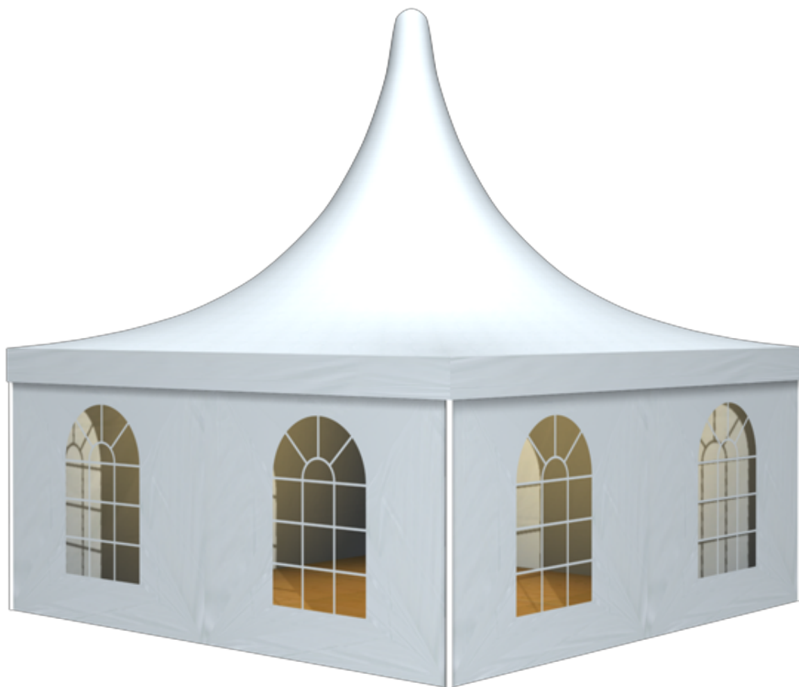
篷房俯视图与侧视图