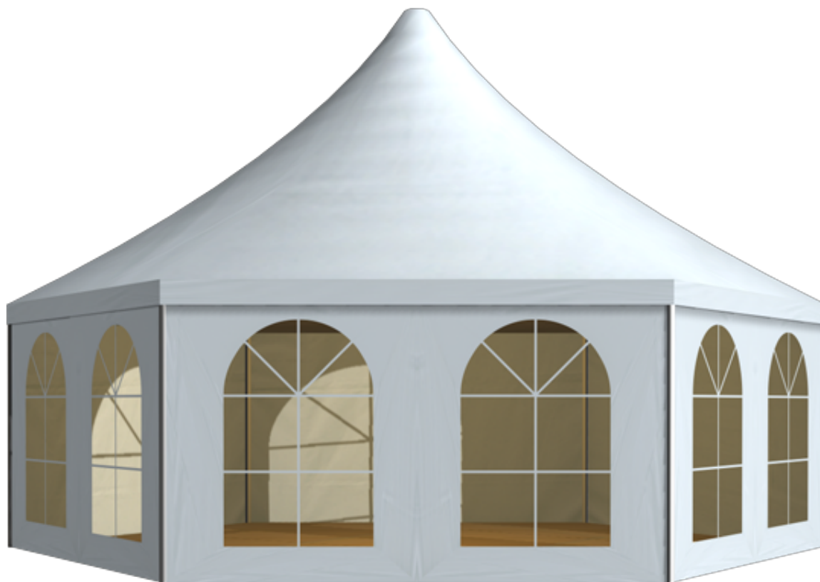
篷房俯视图与侧视图